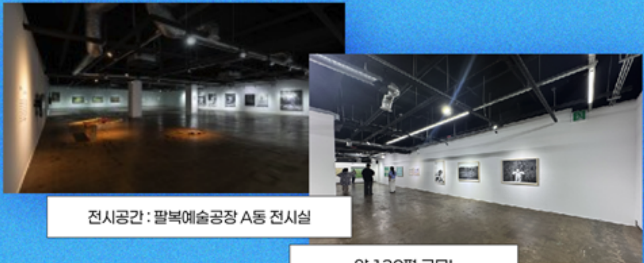
전시공간 : 팔복예술공장 A동 전시실